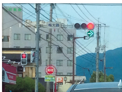
梅大路交差点にも 矢印信号がつかました!