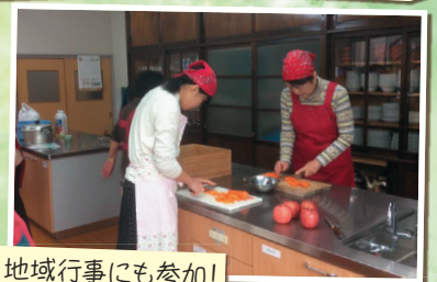
地域行事にも参加!