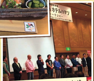
地域を担う若者達との意見交換