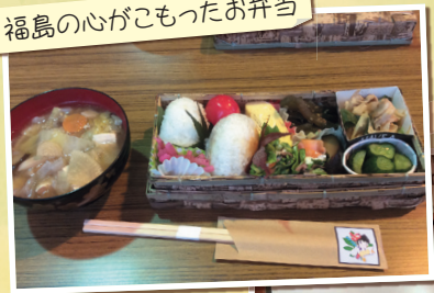
福島のがこもったお弁当

また、郡山 こおりやま では第一次産業に就業している若者との意見交換も行いました。震災から毎年このような視察ツアーに自費で参加しています。